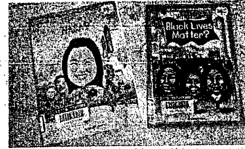
『What is NASA?』 Penguin Random House 837 W