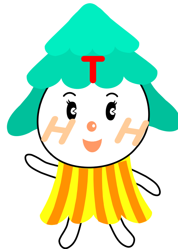
高井戸東小学校 キャラクターマスコット 「ひがっしー」