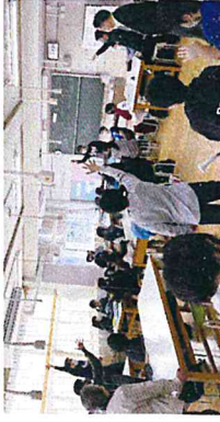
景品争奪ジャンケン大会も盛り上がりました!