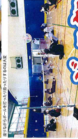
座りながらボールを打ったり拍ったりするのは大変