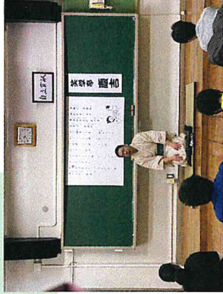
演目はじゅげむ、最い名前の意味を落語で聴きながら覚えしました。