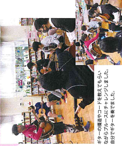
ギターの構造やコードを教えてもらいながらフルコースにチャレンジしました。自分でギターを奏でました。