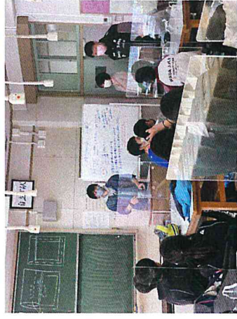
学ボラさんが、丁寧にやり方を説明しています。