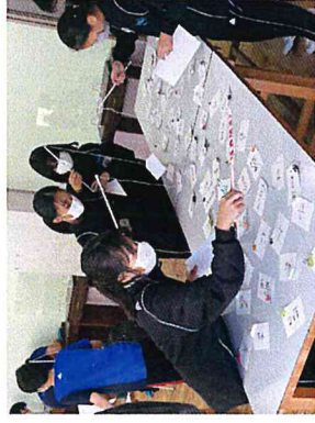
間違った答えもあるから、さっと正解を釣りあげよう。

英検と数検の問題を解いて、答えを釣り上げました。 楽しみながら検定の問題に触れることができました。 当たりを釣ったら景品ももらいました。