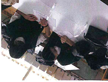
問題を解くときは真剣です。