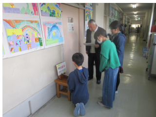
CS委員の方々を作品展ガイドする6年生の子どもたち

22日(土)の土曜授業・作品展にはたくさんの保護者・地域の皆さんにおいでいただきありがとうございました。 今年度最後の学校公開でしたが、この1年の子どもたちの成長をご覧いただけましたでしょうか。授業内容も学校支援本部やゲストティーチャーをお招きした授業、地域の専門家の方々にご協力いただいた防災教室など、和田小が今年度大切にしてきたかわりの中で学びを深める授業をご覧いただきました。来年度の和田小でも子どもたちにとって楽しい授業をつくっていきます。