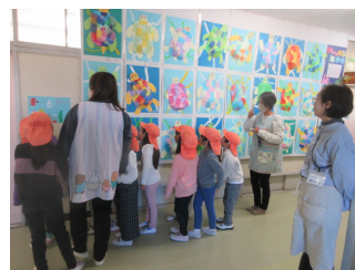
作品展を見て感動して帰った保育園・幼稚園の子どもたち

また、作品展にもたくさんの方々においでいただきました。「ひらめき キラリ ドリームオーシャンストーリー」をテーマに、和田小全体を大きな海に見立てて1年生から6年生までが作品づくりを工夫しました。22日(土)は一昨年の作品展に引き続き作品展ガイドを行いました。ご覧いただいた皆さん、CS委員の皆さんから大好評でした。和田小の子どもたちが、これからの社会で必要なプレゼンテーション能力やコミュニケーション能力を身に付けていて頼もしく思いますとのうれしい感想をいただきました。来年度の和田小でも子どもたちがかわりの中から学んでいくような授業を工夫していきます。