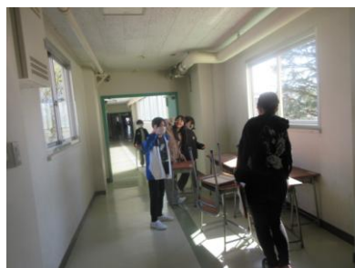
4月3日(金)に入学式準備・新学期準備のために、大活躍してくれた6年生

いよいよ今日から 令和8年度の和田小 がスタートしました。4月1日にスタートした「わだっ子ルーム」で会った子どもたちも元気だったのですが、今日の始業式での子どもたちは、一段とたくましくなったように思えました。特に 最高学年の6年生 は、3日(金)に入学式前日準備のために登校