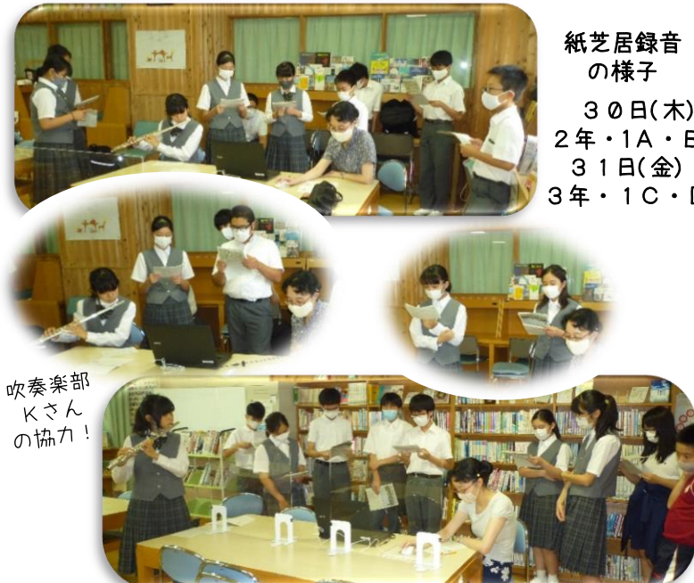
吹奏楽部 Kさんの協力！