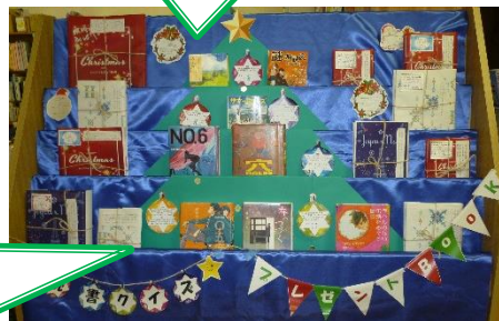
※出題した「読書クイズ」展示中！

行事が目白押しだった2学期もあとわずかとなりました。16日から冬休み貸出(一人5冊まで)が始まっています。ぜひ長い冬休みにじっくり読む本を選びに来てください。「英語多読の本」「図書委員からのプレゼント本&読書クイズ本」「寒い冬におすすめの本」など展示しています。