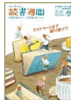
「読書週間」ポスター

普段は自転車で通勤していますが、雨が降ると地下鉄を利用します。荻窪駅から趣ある佇まいの住宅地を歩いていると、金木犀の甘く爽やかな香りが漂ってきます。雨の日が嬉しくなるひと時です。さて、10月27日から11月9日は読書月間です。今年度の標語は、「ラストページまで駆け抜けて」です。学年別競技会の後は、本の世界をめぐるませんか？