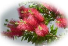
正門前ブラシの木