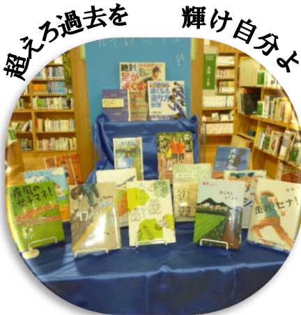
陸上テーマの本展示中！

昭和25年4月30日、画期的な文化立法である図書館法が公布され、日本の図書館活動は新しく生まれ変わりました。それを記念して、4月30日を「図書館記念日」としました。さらに、それに続く新緑の季節である5月1日～31日を図書館振興の月としました。