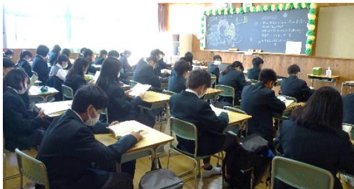
* 1年生 朝読書の様子

図書館からのお願い 春休みの前に借りた本は、 返却期限が過ぎています。 速やかに返却してください。 図書委員会では延滞者の を目指しています。