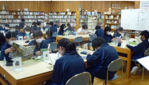
* 1年生 図書館オリエンテーション

初代「香君」によって「神郷」からもたらされたという「オアレ稲」は、荒れた土地にも穂を実らせ、その稲を管理することで、ウマル帝国は周辺諸国を平定していきます。実はこの稲には、他の作物が育たなくなるなど怖い性質もあり、害虫がつかないはずのオアレ稲に虫害が発生したことで依存しすぎていたウマル帝国は、食糧危機に見舞われます。アイシャは当代「香君」オリエと共に人々を救おうと奔走します。オアレ稲が「香りの声」で呼び寄せようとしているのは一体何なのか。自然界の生態に迫る壮大なファンタジー。